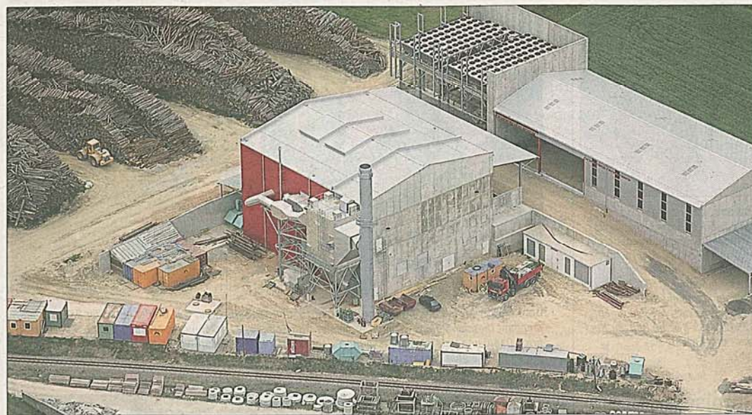
Gleich hinter dem Betonwerk Seidl in Altweitra erstreckt sich das Areal des NAWARO-Biomasse-Kraftwerkes. Es soll in den nächsten Wochen in Vollbetrieb gehen und Strom ins örtliche EVN-Netz liefern.

Die bei der Stromproduktion entstehende Abwärme wird im Betonwerk Seidl zur Trocknung der Produkte verwendet. Außerdem gibt es Gespräche über den möglichen Ausbau eines Fernwärmenetzes von Altweitra aus.